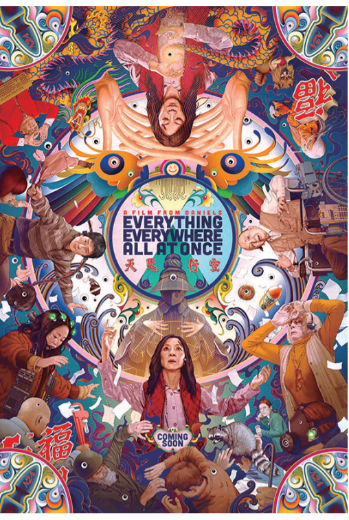
《瞬息全宇宙》电影海报