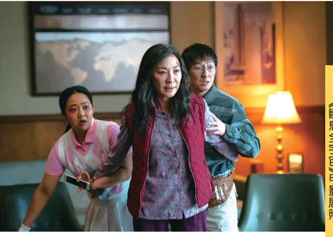
《瞬息全宇宙》电影剧照