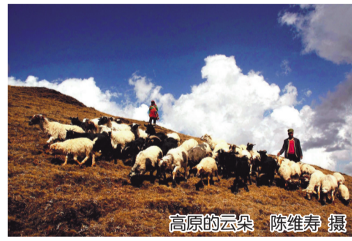
高原的云朵

在全面决战决胜脱贫攻坚这一历史性战役结束后，陈维寿取材脱贫攻坚的作品《家住深山有远亲》入选由中国日报社和中国画报出版社策划编辑的《百名摄影家聚焦脱贫攻坚》画册，该画册入选中宣部办公厅“2020年主题出版重点出版物选题目录”。这充分体现了摄影艺术家身处大时代背景下，与人民同呼吸共命运的责任和良知。