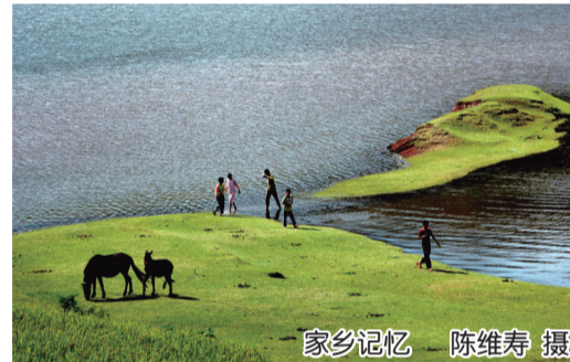
一家记忆

陈维寿不仅行走在彝乡大地，同时还在不断拓展视野。他曾走近秦岭，接受中原文化的浸染；多次穿越西藏雪域高原，让圣洁雪山和茫茫原野为灵魂洗礼，作品越发凝重而灵动。行走是寂寞的，唯有在孤独中寻觅与坚守，才能让精神遨游于天地间，找到艺术的真谛。千里彝山历史悠久、文化璀璨。在这块多民族世代聚居的土地上，各民族独特灿烂的原生态