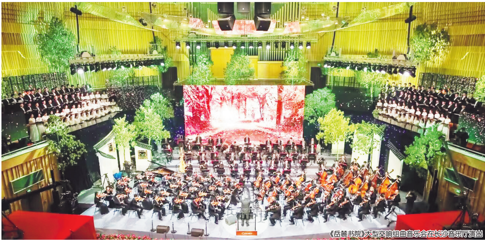
《岳麓书院》大型交响组曲音乐会在长沙音乐厅演出

岳麓书院历经千载弦歌不绝,今天依然游客如过江之鲫,膜拜顶礼者潮涌,其真正的生命力还在于思想。是“实事求是”这一巨大思想贡献,使岳麓书院以强大无比的历史穿透力,获得了永存魅力。正如习近平总书记于2020年9月考察湖南时指出的:“岳麓书院是党的实事求是思想路线的一个策源地和重要影响的地方。”中共长沙市委宣传部紧扣这一思想文化精髓,牵头组织创作了大型交响组曲《岳麓书院》,邀请作曲家廖勇先生作曲,指挥家余隆先生执棒,今年首演并获得巨大成功。音乐会所极力展现的,正是“实事求是”这一核心意象,仿若与那块高挂书院讲堂中心的匾额“实事求是”交相辉映。