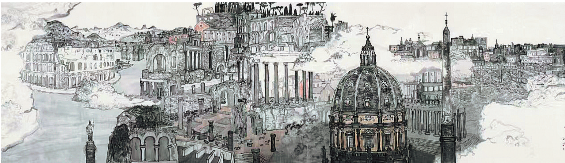
帕拉蒂尼山下的罗马(中国画) 方向作