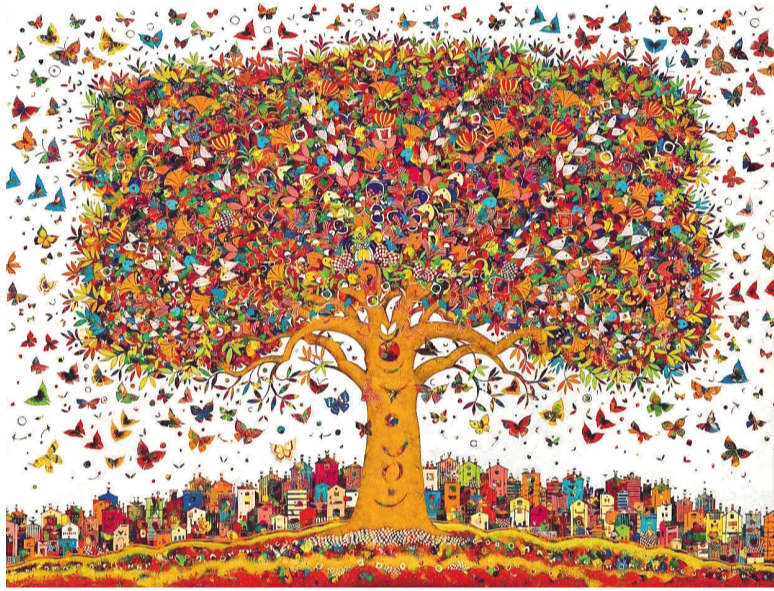
生命之树(油画) 让·佛朗索瓦·拉瑞尔(法国)作

据悉,此次首展将持续至9月8日。下半年还将在安徽、新疆进行巡展,2024年至2025年将展出“一带一路”国际美术工程”版画、雕塑以及海外艺术家的作品。(郭文)