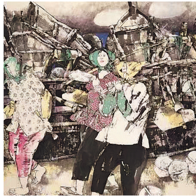
赶海(中国画) 张道兴作