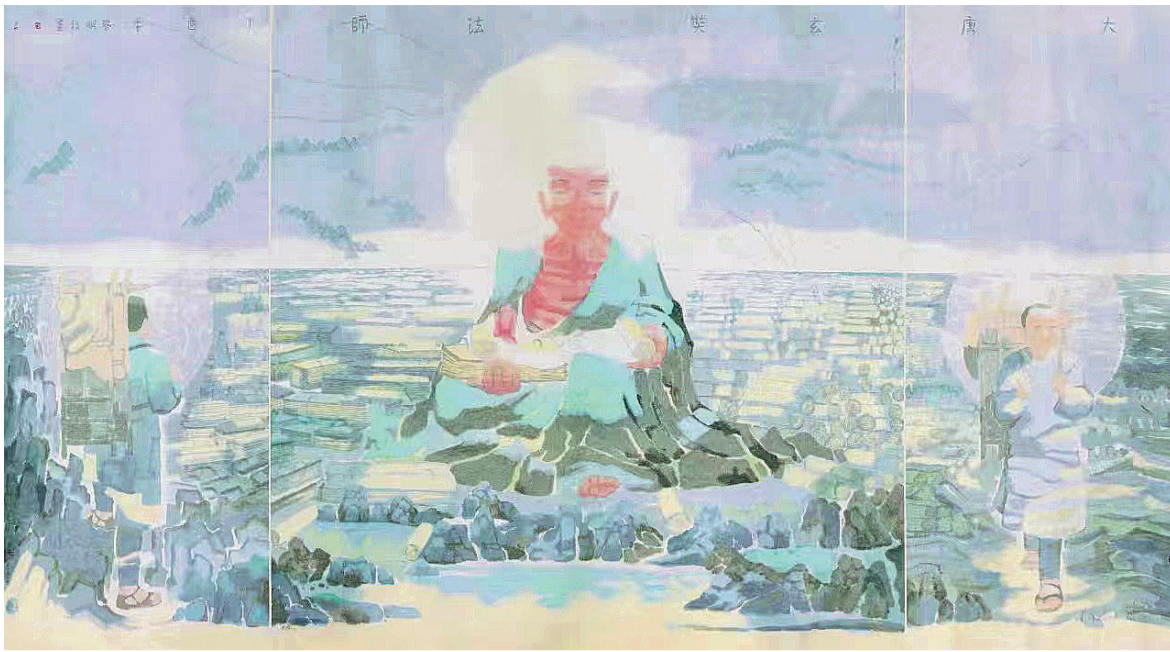
大唐玄奘法师(中国画) 田黎明作