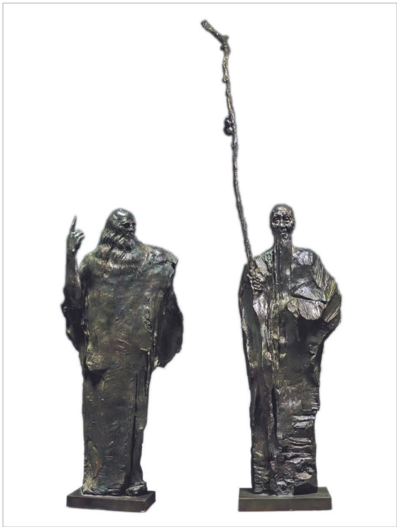
超越世空的对话——意大利艺术大师达·芬奇与中国画家齐白石(雕塑) 吴为山作