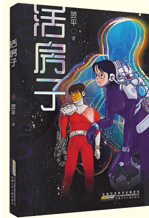
《活房子》翌平著，安徽少年儿童出版社，2023年4月出版

本书是一部聚焦未来世界人类面对灾难时的生死抉择和自我救赎，重点探讨当下科技热点话题的少儿科幻小说。书中三个女孩共同生活在一个“房子”里，然而这并不是真正的房子，而是人类遭遇大辐射后，为了保存新生力量，由成年人捐献出来的身体——供出来的脑组织顺利成长的“活房子”。由此，作品呈现了人类生命与电子生命之间的伦理纠葛，展现出生死存亡时刻的人性光芒。