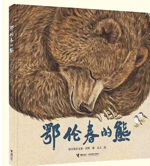
《鄂伦春的熊》格日勒其木格·黑鹤著，九儿绘，接力出版社，2023年7月出版

本书是一部聚焦未来世界人类面对灾难时的生死抉择和自我救赎，重点探讨当下科技热点话题的少儿科幻小说。书中三个女孩共同生活在一个“房子”里，然而这并不是真正的房子，而是人类遭遇大辐射后，为了保存新生力量，由成年人捐献出来的身体——供出来的脑组织顺利成长的“活房子”。由此，作品呈现了人类生命与电子生命之间的伦理纠葛，展现出生死存亡时刻的人性光芒。