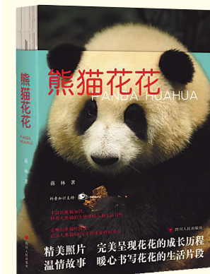
《熊猫花花》蒋林著，四川人民出版社，2023年5月出版

本书从考古启蒙的视角出发，深入浅出地讲述了什么是考古学、考古学家需要具备哪些方面的知识储备、去哪里挖掘以及具备的挖掘工具、挖掘的文物如何鉴定等孩子感兴趣的话题，并对考古发现的秦始皇兵马俑、马丘比丘、庞贝古城、石窟壁画等世界文明遗迹进行了详尽说明。该书能让孩子们看到被尘封的历史和人类进化发展的历程，是一本反映真实历史的考古科普读物。