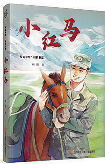
《小红马》，杨娟著，江苏凤凰少年儿童出版社，2023年6月

《小红马》的叙事节奏非常紧凑。从踏上运送物资的征程的那一刻起，“丛林”“冰河”“沼泽”“雪山”“哨所”“回家”这六个章节就交织成一张罗网，雪域高原迎候着人类的踏足，它从不“怜惜”人类和骡子的体能极限，从不照拂他们基本的生存要求。在这片人类生存禁区里，不断被蚊虫叮咬、脚底满是血泡、误食毒蘑菇而昏迷都只算是可控的小事。大自然用最冷峻的冰河、泥石流和沼泽磨炼他们的肉身和心灵。长眠于此的小红马的哥哥“小黑马”、葬身急流的“老大哥”等成了骡马队悲壮的新路标。在这场紧锣密鼓的征程里，战士们适时地埋锅造饭，就地取材地补充食材、烹饪出香喷喷的晚餐，用蕨类叶子叠成的“毡床”、搭建出“帐篷”，显现了人类在极端环境下的生存智慧。