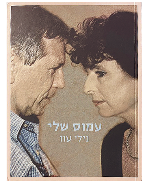
奥兹夫人尼莉的回忆录《我的阿摩司》书影

奥兹虽然肯定了索莫身上的诸多优点,如善良、忠诚,懂得关心与爱护家人,但对他的宗教狂热与狭隘心胸进行了无情的讽刺。借吉代恩、吉代恩的律师曼弗雷德、布阿兹等人之口,索莫被描述成“伪善的家伙”,本意还好但令人讨厌,是狡猾而雄心勃勃的狂热之徒,具有“梦游者般的自信”,