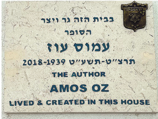
写有“作家阿摩司·奥兹(Amos Oz, 1939-2018)在这所房子里生活,并从事创作”的标牌

今年7月20日,即将离开特拉维夫的那天,我乘坐出租车前往坐落在列维坦大街的奥兹寓所。以色列的出租司机大多比较健谈,边开车边指点我一些标志性建筑。车子行驶到泰戈街,他说以色列前国家领导人拉宾和佩雷斯都住在附近。我也积极地予以回应,说自己当年就是在位于泰戈街的Ulpan接受的希伯来语启蒙教育。当然,我也清晰地记得奥兹告诉我如何从大学走到他家的情景。从泰戈街再拐过去,便是奥兹家人居住的那条街。公寓楼前挂着一个简朴的标牌,上面写着“作家阿摩司·奥兹(Amos Oz, 1939-2018)在这所房子里生活,并从事创作”。