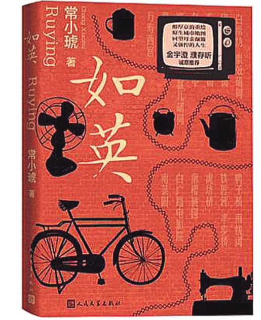
《如英》,常小斌著,人民文学出版社,2023年1月

我书中的知青回城后,不仅被城市忽视,还被家庭内部的至亲之人视为异类。这种状态和现象是当时存在的,令一部分返城知青心灵无处安放。如果有人读完这本书能感受到这之中的不对劲和