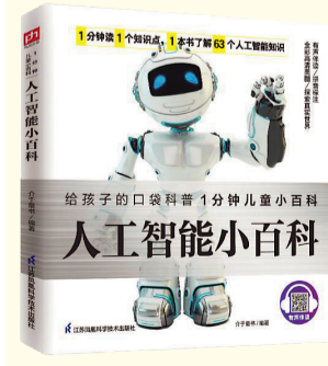
《人工智能小百科》介于童书 江苏凤凰科学技术出版社 2023年7月出版

也许,每个上学的孩子都有过迟到的时候,那时的我们会想各种理由来为自己辩护。本书是第五届“信谊图画书奖”图画书创作奖首奖作品,以小猪上学迟到来作为引子,讲述了许多人的童年都会发生的迟到故事。绘本以幽默的笔触和丰富的想象串联起童年生活的普遍经验,生动形象的绘图将小孩子的慌乱忐忑心情勾勒得真实可感,故事结尾言简意赅地以一句话收尾,让孩子们明白“诚实才是最好的理由”。