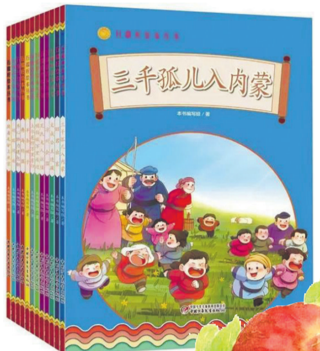
“石榴籽绘本丛书”,内蒙古自治区党委宣传部、自治区文联组织编写,中国少年儿童出版社,2022年9月

各民族为了维护祖国的统一、保卫领土的主权,同心同德、尽心尽力。公元13世纪中期,元太宗窝阔台命王子阔端驻守凉城,阔端邀请西藏萨迦派大学者萨班来凉州会谈。《凉州会谈》写了这一段历史,他们就西藏归属蒙古汗国达成了共识。到了公元16世纪,明朝嘉靖年间,倭寇猖獗,骚扰沿海。从小习武、