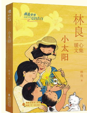
《林良暖心文集·小太阳》林良著 福建少年儿童出版社 2023年5月出版

“家”在林良笔下,因着家人点点滴滴汇流出的欢喜悲伤,成为24小时都有故事、永远不黯淡的金色盒子。他在这本书中记录了生活中不能重来、可贵感人的片段,以特有的流畅文笔,诙谐幽默的文风,栩栩如生地书写着点滴琐事中耐人寻味的幸福,给读者满满的爱和温暖。作品设有“大人”姿态,而是以同理心的聆听、不带批判的话语,与孩子探讨成长课题,传递值得现代青少年追求的美好价值。