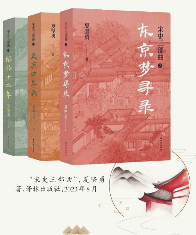
“宋史三部曲”，夏坚勇著，译林出版社，2023年8月

历史反射文学，是衡量作家把握历史题材价值理念的试金石，无疑，夏坚勇的作品往往在大变局的历史节点中，找出了让人会心的答案。 夏坚勇是开拓者。在这里，我们看到的是让史料在虚构的描写当中，走向现实、走向未来的一时期许