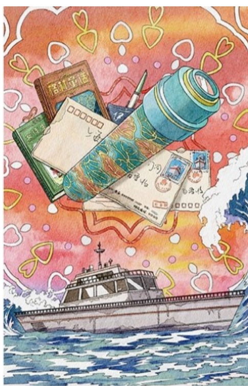
《万花筒》插图 老朱设计工作室·郭政泽 作

本书讲述了一个怀揣英雄梦的少年桑果通过科学老师打造的“镜像转换系统”变身火箭军战士的传奇经历，展现了少年对“英雄”的重新理解，书写了我国火箭军战士的传奇经历，展现了少年对“英雄”的重新理解，书写了我国火箭军战士的意志品质及舍生忘死的军人精神，并以此作为精神灯塔，指引少年重新认知并找到自我，以仰望的英雄为人生目标，以脚踏实地的态度收获全新成长。