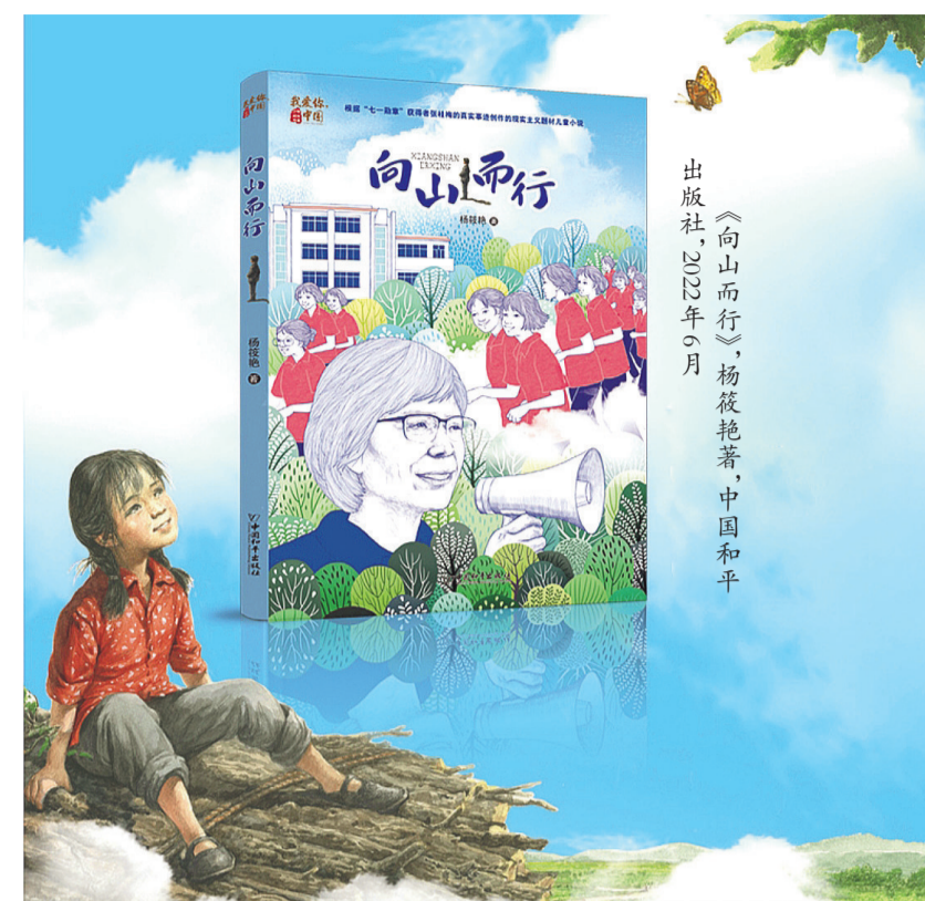
《向山而行》杨筱艳著，中国和平出版社，2022年6月

小说采用双线并行的结构，一方面写当下秀梅老师办女子高中的故事，一方面穿插回望秀梅老师小时候上学的故事。两条线索相互印证，勾勒出了秀梅老师完整的人物形象。正是因为小时