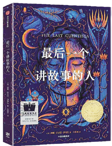
《最后一个讲故事的人》【美】唐娜·伊格拉著，中信出版社，2023年6月

远行人必有故事，对于彼得拉来说，她比利塔还多了一份责任，她已经是最后一个葆有地球记忆的人，在绝境之中，更要让这故事流传下去。她在对苏马、羽毛讲故事的同时，也是在用行动书写自己的故事，这就是利塔曾说的发现自己是谁，先做自己，再将它们变成自己。读者