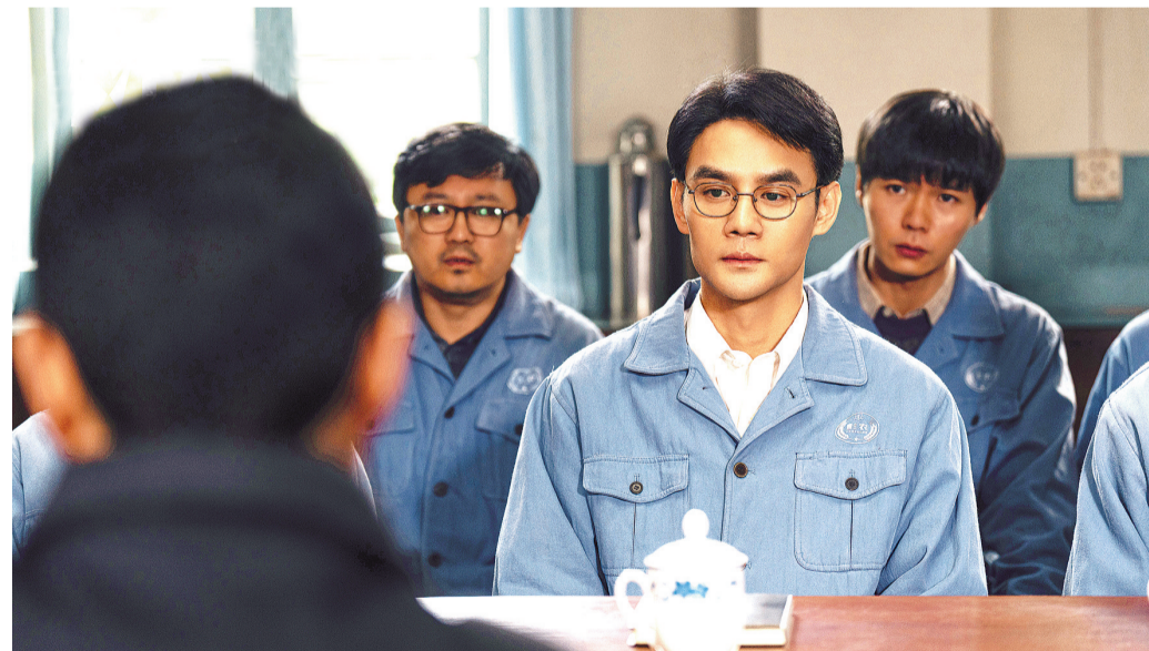
《大江大河之岁月如歌》剧照

在这一部中,剧作对于历史事件的分析维度更加多元,这是对于历史的尊重,也是文艺表现手法提取现实主义能量的客观要义。剧中,在