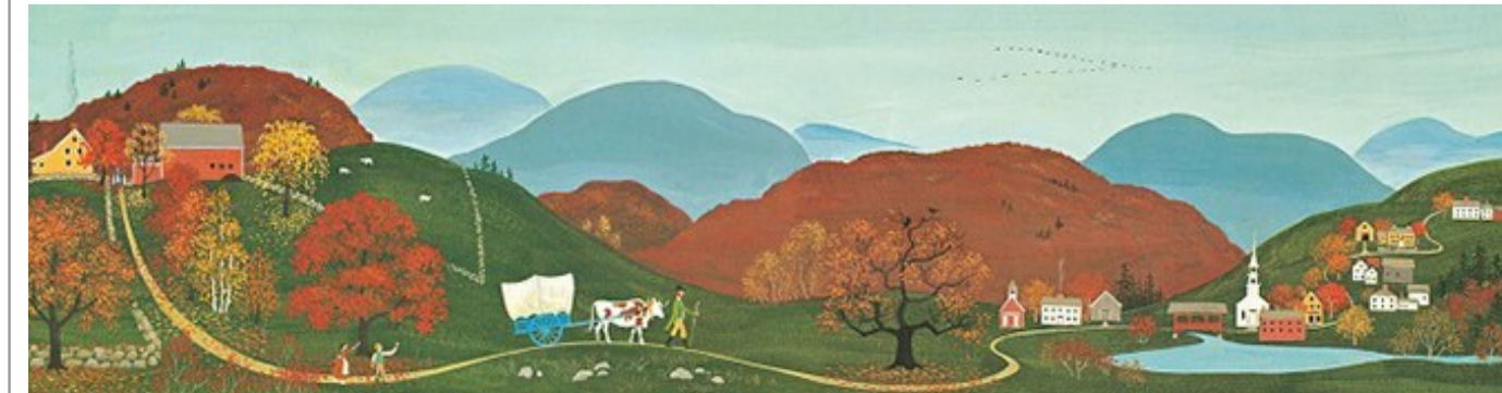
《赶牛车的人》插图（美）芭芭拉·库尼绘，新星出版社，2021年1月