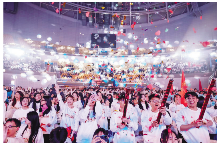
第十二届中国大学生电视节开幕式暨“放飞梦想”青春歌会现场

在“绽放”主题大学生创作扶持活动的现场,怀揣着影视梦想的青年学子借助这一舞台讲述着各自精心准备的作品提纲。此次征集从收到的263部大学生剧本、影视策划作品中评选出了《AI·爸爸》《缺席的乐团》《向山海走去》等5部作品进行集中展示,这些作品的主创人员与专家评委、大学生观众进行了现场沟通交流。北京师范大学艺术与传媒学院副院长杨秉虎谈到,与去年相比,今年的学生作品所展现出的专业性、创新性令人欣喜,这5部作品的创作者观察和感知社会与人生的角度十分多元,呈现出有根系、有生长、富含青春气息的全新姿态。大视节搭建起的这一交流平台也让未来的学子看到了一种可能,那就是创作者可以把中华优秀传统文化传承创新的使命,对当下中国社会发生变化的思考等话题带入到个人的创作中去,这样的创作一开始可能不完善,但已经具备了成功的可能性。