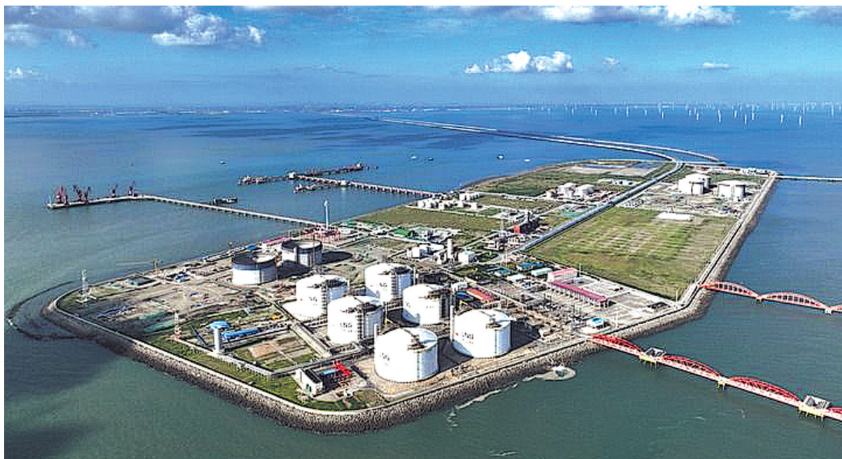
2023年9月航拍的江苏如东洋口港

近年来报告文学作家走进广阔的现实生活，热情高涨，创作出了大量具有现实性品格、风格各异的作品，承载起新时代文艺的浪起潮涌。其中，聚焦于重大工程项目主题的报告文学，既是纪事与写人相结合的历史书写，也是读懂中国跨越式发展的时代表达。