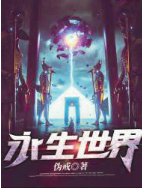
《永生世界》，伪戒著，连载于17K小说网

你还愿意生活在永生世界吗？其实，永生即永死，永死即永生。（作者系中山大学中文系博士生，中国鲁迅研究会会员）