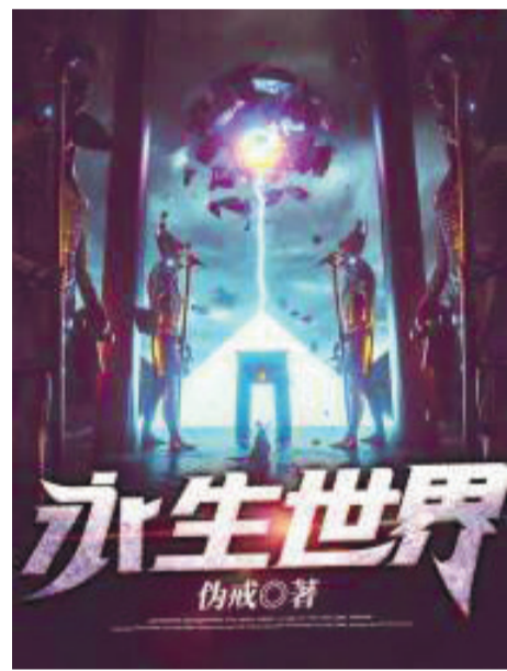
《永生世界》,伪戒著,连载于17K小说网