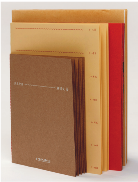
《周庄身世》，杨明义著，江苏凤凰教育出版社，2024年1月

画家陈逸飞的油画《故乡的回忆——双桥》，使江南古镇周庄声名鹊起，引得海内外游客蜂拥而至，争相一睹水乡“村姑”的芳容。