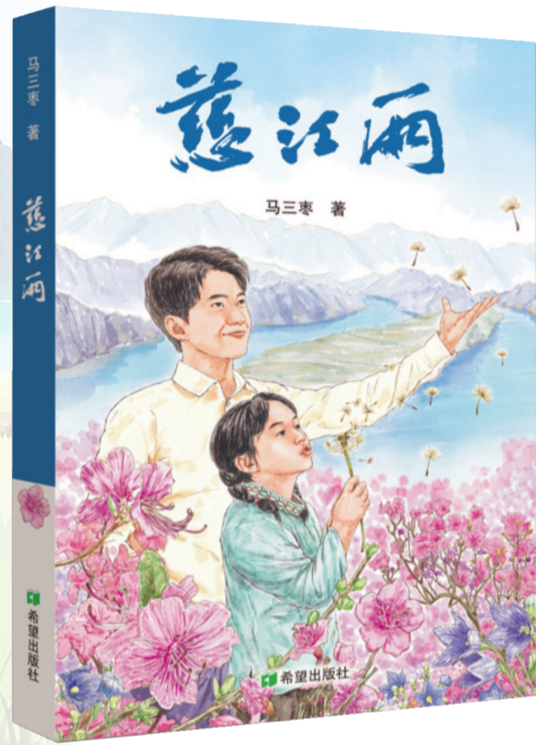
《慈江雨》，马三枣著，希望出版社，2023年7月