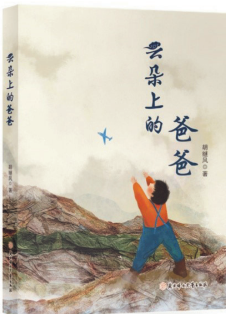
《云朵上的爸爸》，胡继风著，北方妇女儿童出版社，2023年12月