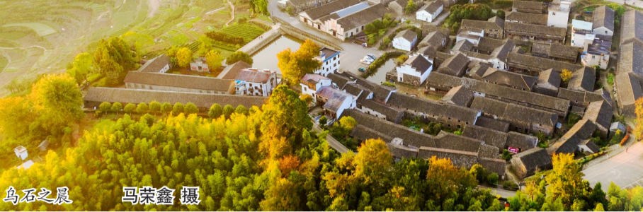
乌石之晨