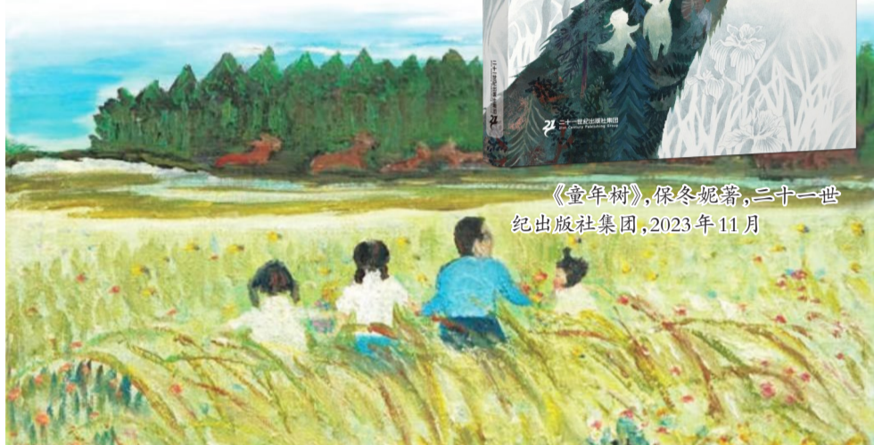
《童年树》，保冬妮著，二十一世纪出版社集团，2023年11月

人文关怀。在《童年树》中，作者有意无意地将那里的动物与孩子紧密结合在一起，借助充满童趣的内心描写和恰到好处的比喻，让年轻而鲜活的生命相互映照、彼此关心、共同成长。