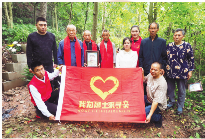
团队送朱有光烈士遗像回家