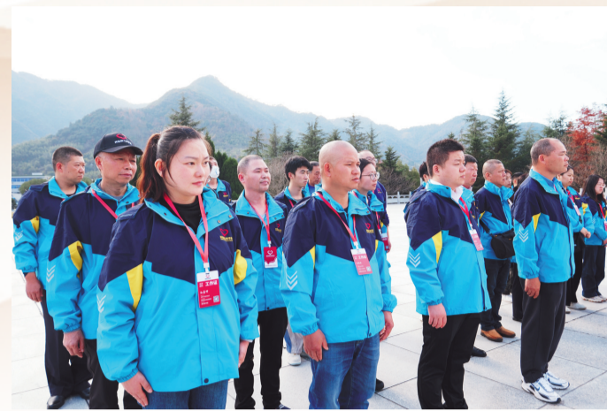
“我为烈士来寻亲”志愿服务团队