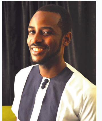
苏伊·戴维斯·奥孔格博瓦

总体而言,非洲英语文学在2023年展现了丰富的主题和丰沛的创新活力,反映了非洲国家的历史、现实和女性命运,也呈现出独特的非洲特色文化和魅力。(作者系中国社会科学院外国文学研究所《世界文学》编辑)