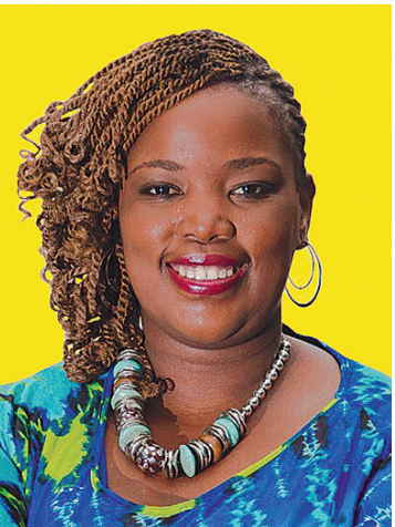
诺武约·罗莎·特舒马

非洲英语文学在2023年继续呈现多元化发展趋势,涵盖了广泛主题,包括种族、性别、身份、社会正义、历史传承和全球化等,这一年的新作不仅关注非洲本土问题,也探讨了非洲人在全球语境下的经历和挑战。总体而言,2023年的非洲英语文学主题可以大致划分为以下三类:一是历史与当代,2023年的作品既关注历史议题,如殖民主义、独立运动等;也关注当代问题,如经济发展、政治变革、社会冲突和社交媒体等,这种结合使得非洲英语文学具有强烈的现实意义和时代感。二是女性与全球化,这类作品展现了非洲女性的生活,并探讨了非洲女性在全球化时代面临的机遇与挑战,包括职业发展、身份认同、爱情与婚姻等方面的选择。三是奇幻与非洲文化,这类奇幻吸收了非洲各地的神话传说和非洲特色文化元素,如非洲民间传说中的魔法和非洲传统的口头叙事风格等,构建了独特的奇幻世界,它们在奇幻的外壳下,探讨了严肃的主题,体现出非洲文学的创新和活力。