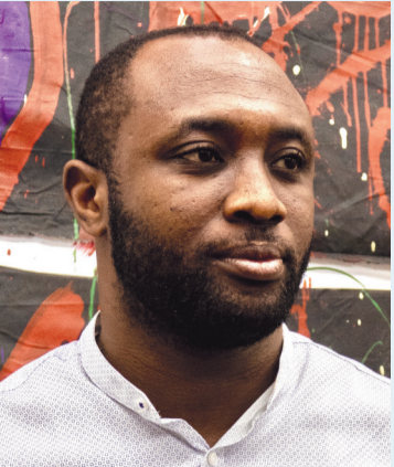
埃马纽埃尔·伊杜马