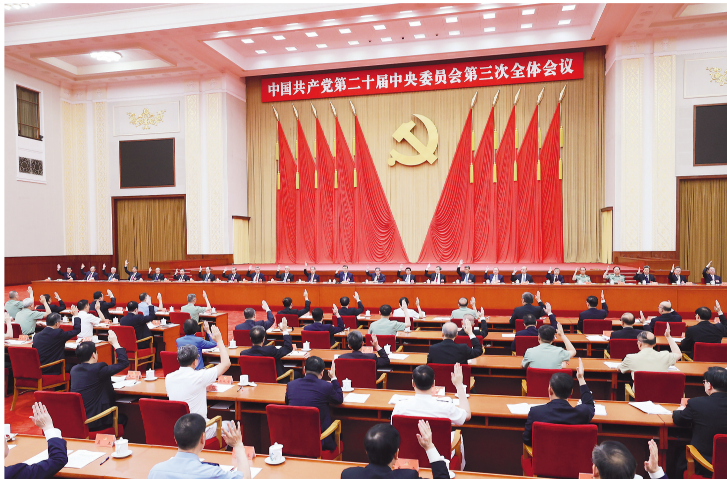
中国共产党第二十届中央委员会第三次全体会议，于2024年7月15日至18日在北京举行。中央委员会总书记习近平作重要讲话。