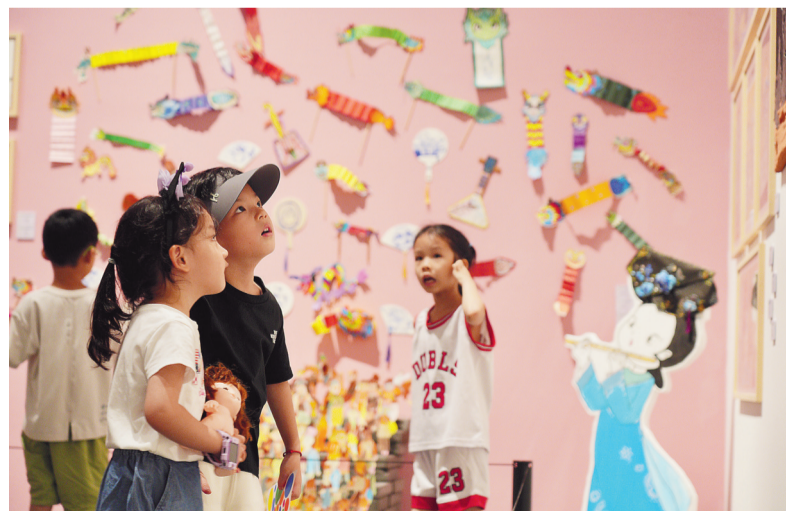
“艺梦同绘·缤纷的种子”儿童主题艺术展现场

为了让每个走进美术馆的人，都能从展览和公共教育中有所收获，策展团队将公共教育也加入前期策划，一起寻找更适合观众观展与参与的形式，通过作品和活动联结起艺术作品和观众之