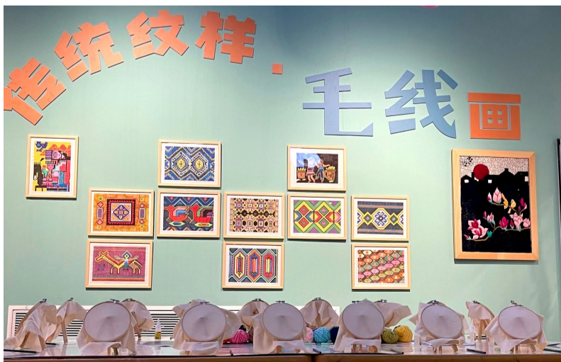
“艺梦同绘·缤纷的种子”儿童主题艺术展现场

懂，以互动的形式引发儿童思考，推动观众在观看画作、表达感受的过程中去寻找和展览相关问题的答案。