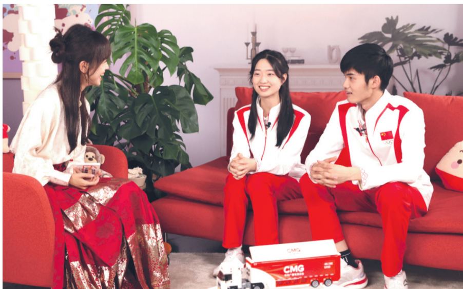
《大红车巴黎不停播》采访现场