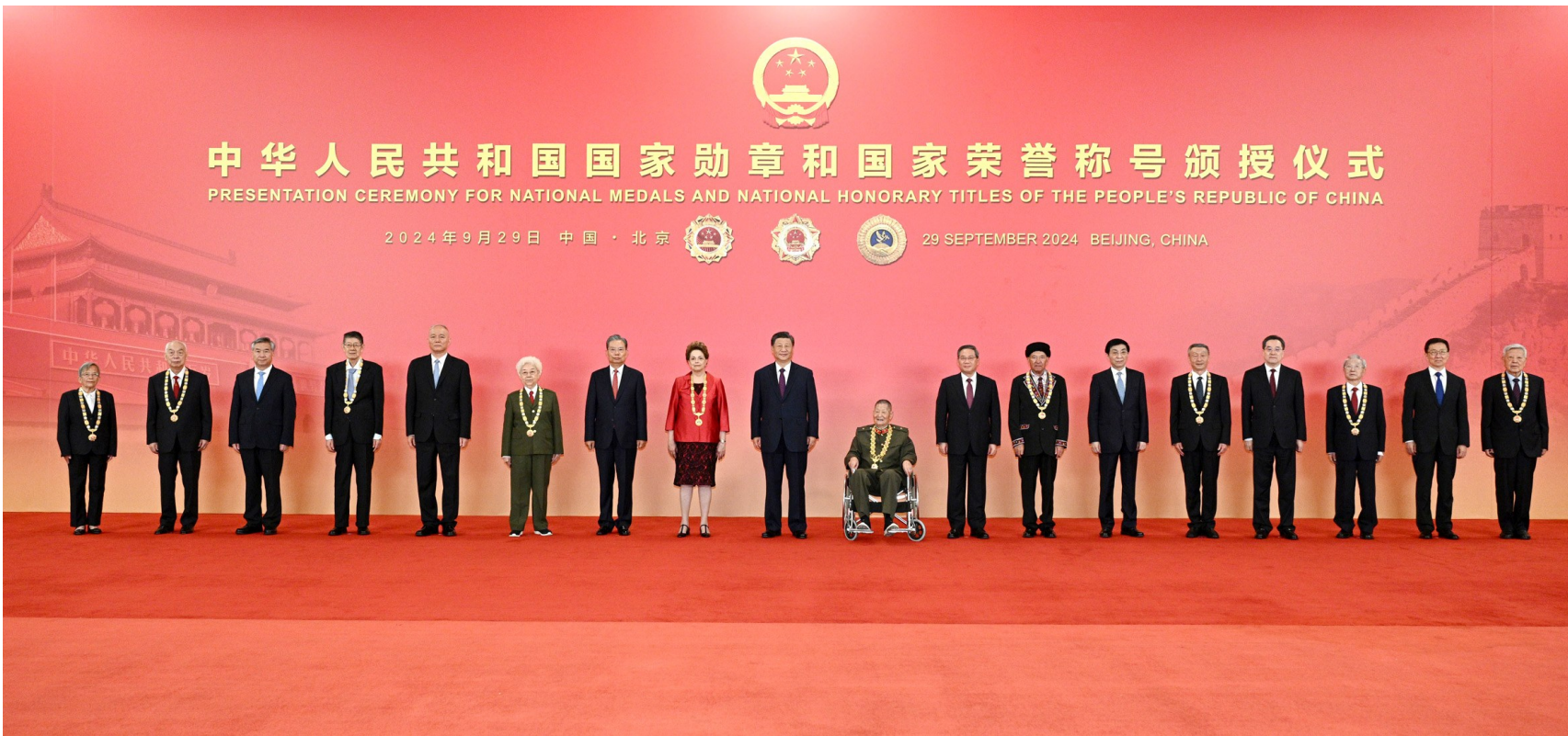
9月29日，中华人民共和国国家勋章和国家荣誉称号颁授仪式在北京人民大会堂金色大厅隆重举行。习近平等领导同志同国家勋章和国家荣誉称号获得者合影留念。

新华社北京9月29日电 中华人民共和国国家勋章和国家荣誉称号颁授仪式29日上午在北京人民大会堂金色大厅隆重举行。中共中央总书记、国家主席、中央军委主席习近平向国家勋章和国家荣誉称号获得者颁授勋章奖章并发表重要讲话。(讲话全文见今日3版)习近平强调，伟大时代呼唤英雄、造就英雄。英雄辈出，党和人民事业就会兴旺发达、长盛不衰。各级党委和政府要关心关爱英雄模范，推动全社会尊崇英雄、学习英雄、争做英雄。希望受到表彰的同志珍惜荣誉、再接再厉，争取更大荣光。