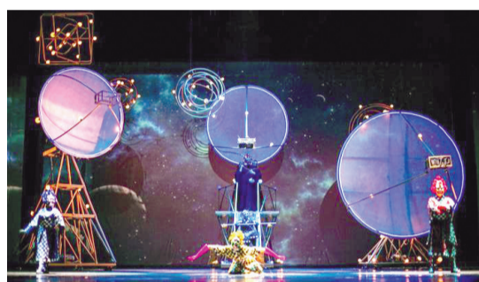
舞台剧《三体2:黑暗森林》布景,呈现裸眼3D效果