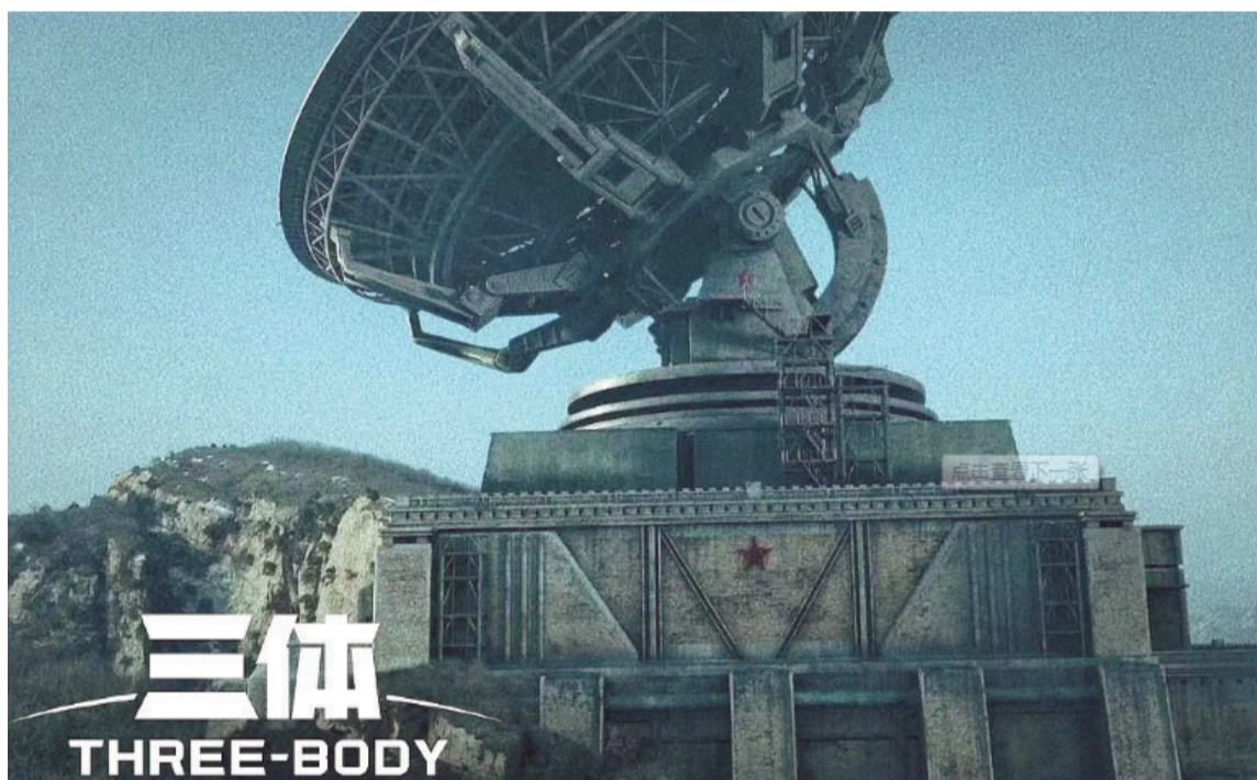
电视剧《三体》中的“雷达”(射电望远镜)