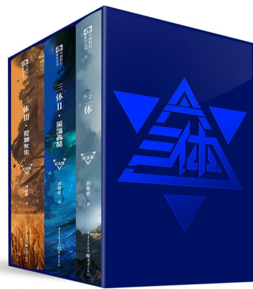
《三体》(精装纪念版),刘慈欣著,重庆出版社,2017年7月

稍稍有点遗憾的是,在过去的百余年里,国人对科幻这一文类的认知一直是处于起伏变化中的。这种起伏和变化时而给文类开放出有效的天空,时而又会封闭起一些区域。因此可以说,全方位开放的科幻发展态势,始终尚未成功地建立起来。最近的10年,厚积薄发的科幻文学在良好的社会和文化环境氛围之下发生了质的变化,以刘慈欣、韩松、王晋康、陈楸帆、郝景芳、海漭等为代表的老中青三代作者,一举把中国的科幻文学推向新文化的中心和世界的舞台。2015年,刘慈欣的小说《三体》获得雨果奖最佳长篇小说奖。紧接着,又有一系列作家通过自己的作品向世界舞台展现了中国人对未来的期许和对过去的反思,把中国的科幻文学提升到了世界的高度。当前,已经被翻译成外语文字的中国科幻作品超过200部,而中国科幻作品的海外销量,在当代文学所有文类作品中也遥遥领先。科幻文学正成为新时代中国新的文学名片,不断引导中国走向世界,让世界认识中国。