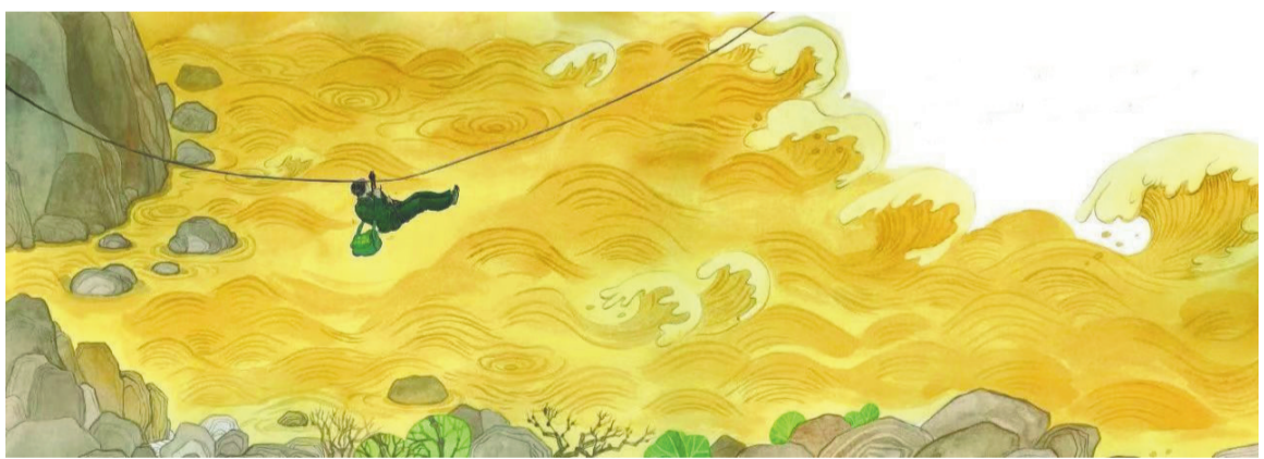
《邮路上的马铃声》插图，长江少年儿童出版社，2024年6月