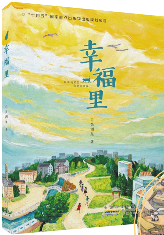
《幸福里》，吴洲星著，安徽少年儿童出版社，2024年5月

五个孩子、五个城市家庭的生活，点点滴滴，伏脉千里，最终在孩子们帮助“猫奶奶”解决不肯搬迁的“心