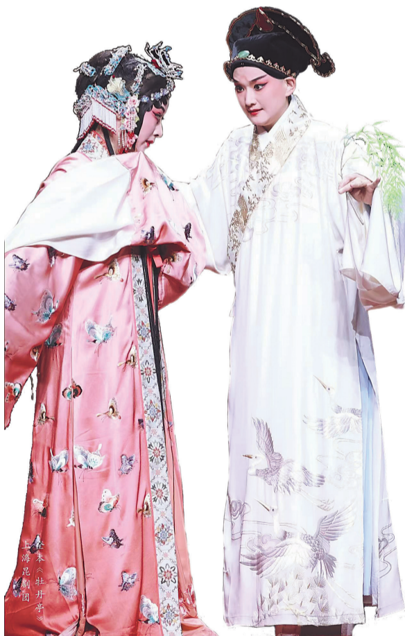
上海昆剧团全本《牡丹亭》剧照

在编排经典剧目的过程中,上海昆剧团充分考虑当下观众的欣赏习惯和演出市场规律,在舞美设计等方面开展了全新的探索与尝试。通过大胆创新的理念和精湛的技艺,力求为作品增添更多的艺术魅力和感染力。例如,昆剧《临川四梦》在舞美上做到了“四场大戏一堂景”,这一设计极大压缩了装台时间,有效控制了布景的制作和运输成本,以便争取到更多的商业演出机会。全本《牡丹亭》采用了360度转台,最大程度控制迁景时间,使得3个晚上呈现55折戏成为可能。这一