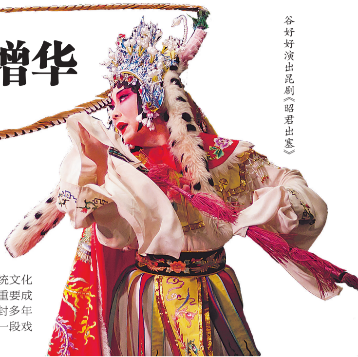
谷好好演出昆剧《昭君出塞》

每到一地方,我们都分外骄傲,我们是来自中国的传统戏曲艺术。“一颦一笑皆是情,一顾一盼皆有