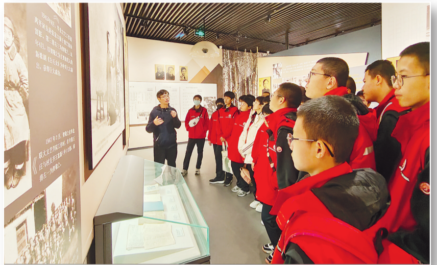
中小学生在河北文学馆开展研学活动，感受河北文学魅力