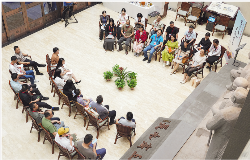
二〇二四年六月十三日，“二〇二四年河北作家活动日”期间，作家代表参加“仲夏夜话”文学沙龙