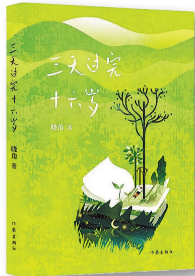
《三天过完十六岁》,晓角著,作家出版社,2024年9月