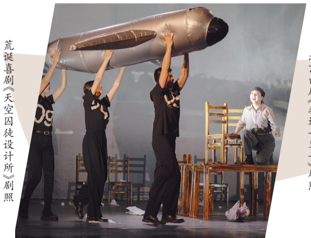
荒诞喜剧《天空因你设计》剧照