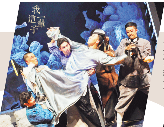
北京曲剧《我这一辈子》剧照