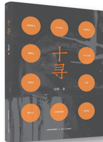
《十寻》,包倬著,北岳文艺出版社,2022年9月

文学是无形的,是水、是阳光、是空气。它是一切,无所不在,千变万化。就像此刻,我仍然能找到写作的意义之一:那就是一个人向世界发出信号,寻找另一个同频共振之人。《十寻》有幸,寻到了知音。