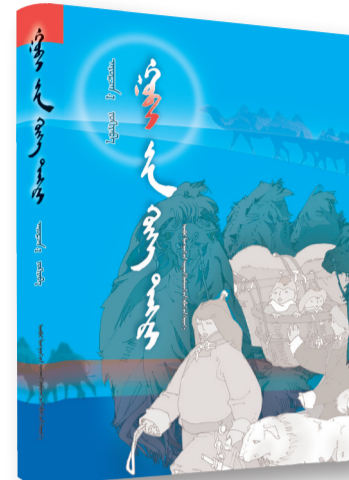
《蓝天戈壁》(蒙古文),阿尤尔扎纳著,内蒙古教育出版社,2021年3月

在这世上,唯有以爱为根基,方可泰康,终得圆满。生活不可缺少爱的滋润。爱能柔化一切,弥补裂痕,使人们得以和睦共存,共享安康。我一直致力于在作品中凸显爱与被爱、宽恕与被宽恕的重要性,通过自己的作品播撒人间大爱,为跌倒之人牵挽架扶,为痛哭之人擦拭眼泪,便是我的夙愿。