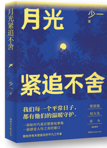
《月光紧追不舍》,少一著,湖南文艺出版社,2023年12月

评委们对《月光紧追不舍》的认可令我深感欣慰。这不仅仅是对我个人文学创作的激励,也是对祖国千千万万基层人民警察的致敬和礼赞。