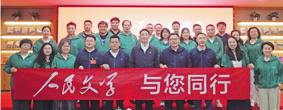
“《人民文学》,人民阅卷”读者交流会合影