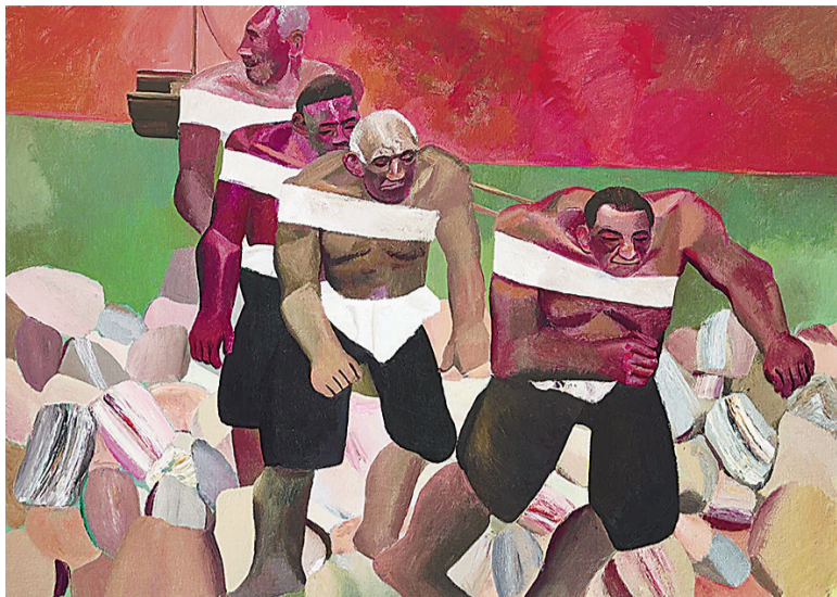
纤夫(油画) 赵培智作

在具体的实施过程中，作品的最终呈现如何更加具体切题，如何避免创作手法的程式化，如何把握创作主题的内核与外延，是对所有参与艺术家的才情与水平的考验。具体到通过艺术作品对长江流域的民俗、建筑、交通、环保等方面的呈现，表现真正意义上人与自然之间的关系，从社会学和家园、人居的角度来看长江的问题等，仍是长江主题创作的难点和重点。