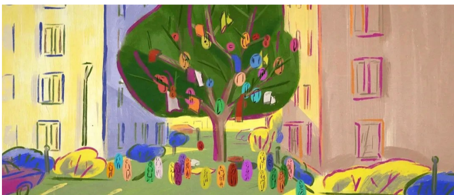
由大色块构成的动画画面

《琳达想吃鸡肉！》不仅是对家庭故事的描绘，影片也让我们相信，无论生活带来多少挑战，家的温暖和亲情的纽带总能引领我们找到和解之路。