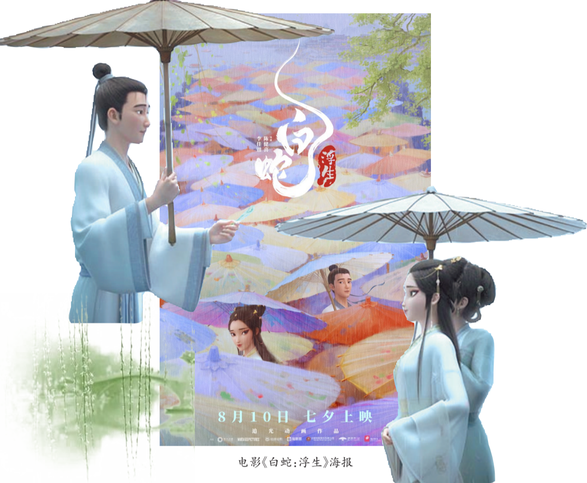
电影《白蛇：浮生》海报

《白蛇：浮生》让故事回归传统，却并未只将“爱情”作为故事表达的主题。在许仙与白娘子的爱情故事里，影片通过各个角色的不同特色，展现人物自我意志的肯定与坚持，让这个古老故事变成关于“人”的传奇。许仙与小白初见，二人眉目有情，正欲互表身份，许仙便一次次被路人拽走行医出诊；在鼠妖投毒案中，他自购药材救助百姓，分文不取，还冒险去山中采药——这些都奠定了许仙忠厚老实、纯真善良、乐于助人、急公好义、偶尔有点呆板迂直的形象。但面对家中变故时，许仙不畏人言，勇于反驳法海，小白误会他，他便直接倾诉心意，为了救助小白不惜牺牲自己的寿命——凡人的勇敢顽强，令妖怪青坊主赞叹，也令法海法师愕然。影片的另一个凡人角色李公甫，则不停把故事从神仙斗法拉回到人间烟火气中。李公甫是个鲜活的“人”，他有官差的身份，时常会吹吹牛、摆摆架子，喜欢张罗事情，即便妻子去世了也在尽心尽力照顾小舅子许仙，许仙信任他，同僚信服他，百姓也愿意对他敞开心扉，因而他能舌灿莲花说服法海跟小青“相亲”，也会在小青以妖怪的样貌与他相见时，一边哭一边接纳她们的身份。与人性的温暖相对的是，小白的温和贤淑里带着报恩的妥协，小青的急躁泼辣里带着野性的不驯，宝青坊主的洞若观火里带着事不关己的冷淡，法海作为修道者，笃信人妖殊途，坚持除妖务尽，在他的原则面前，感情不值一晒。当一部作品里，凡人比神仙妖怪更值得咄咄，那么，它一定会在每一处细节里塞满人间烟火的琐碎日常。