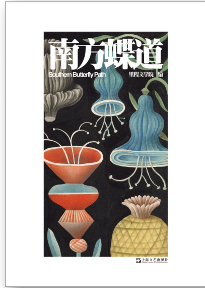
《南方蝶道》，里程文学院编，上海文艺出版社，2023年七月

《发表文学作品奖励制度》，成立湖南青年作家研究中心，作家班、改稿班、“青年计划”“湘军新势力”为青年作家成长成才提供平台，37名青年作家加入中国作协，192名青年作家加入省作协。作为创意写作人才培养的成果展现，湖南作协出版了小说集《南方蝶道》以及“新青年·出版计划”丛书《春天破壳而出》《人物实操课》《看不见的河流》《红瓦分人家》《世事该当如此》等，即将出版《改稿课》《夜空尽头的星》等。湖南师大创意写作专业在校还创作出版了“沃园农场”生态系列童话作品和《山海间的非遗·精灵系列》童话作品。