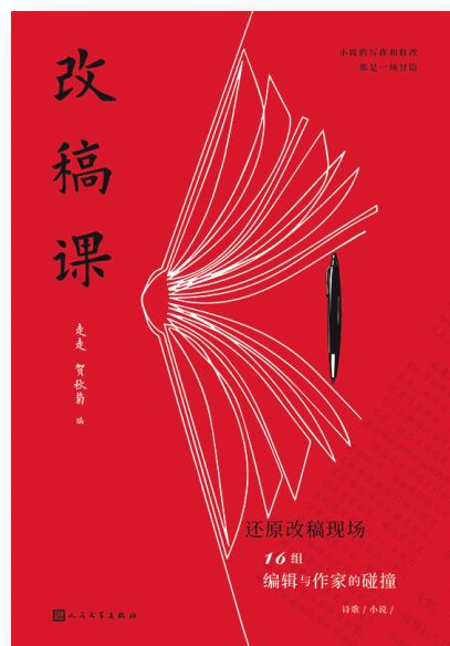
《改稿课》，走走、贺秋菊编，人民文学出版社，即将出版