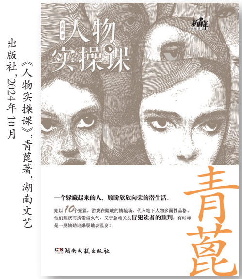
《人物实操课》，青蓝著，湖南文艺出版社，2024年十月