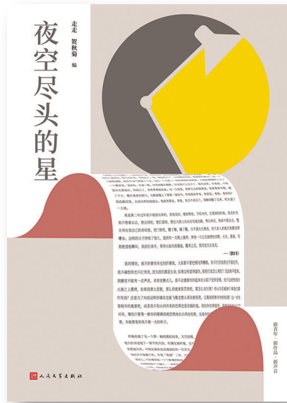
《夜空尽头的星》，走走、贺秋菊编，人民文学出版社，即将出版