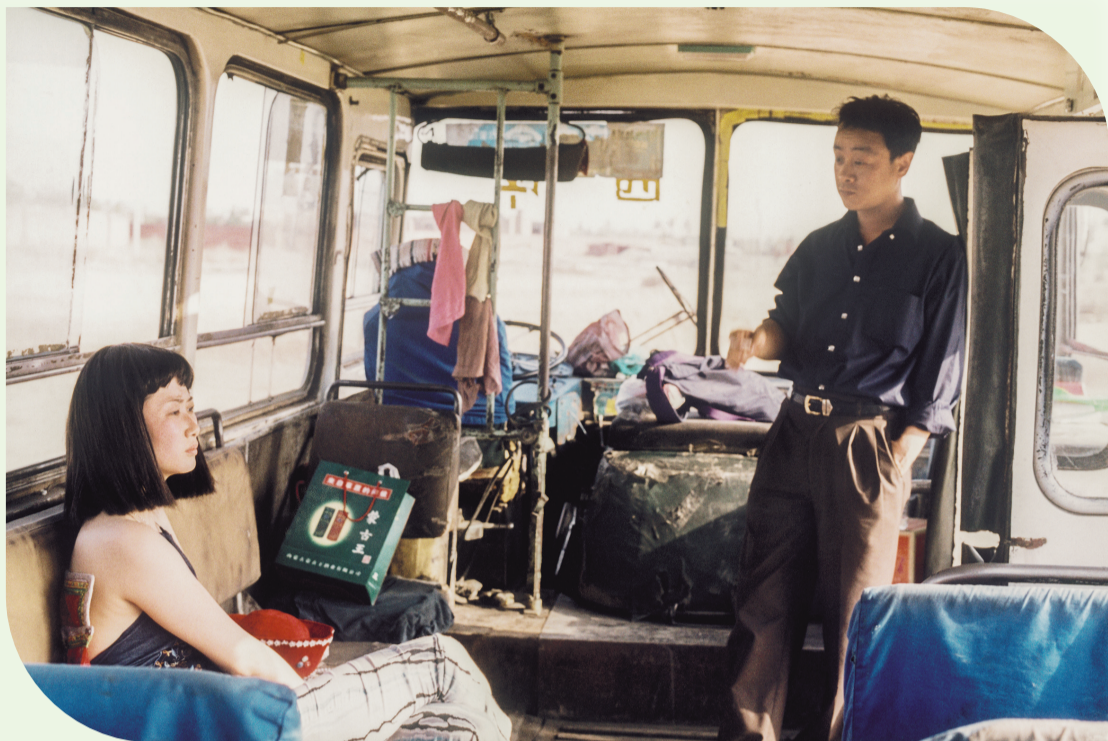
电影《风流一代》剧照

贾樟柯通过对时代面容的凝视,捕捉了那个特定历史阶段的独特气质;通过时代文艺的串联,展现了个人与集体记忆的交织;通过时代影像的怀旧打捞,完成了一次对历史的记录与反思。