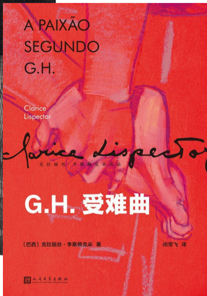
《G.H.受难曲》,【巴西】克拉丽丝·李斯佩克朵著,人民文学出版社,2025年1月

1964年,巴西作家克拉丽丝·李斯佩克朵出版了《G.H.受难曲》,这是一部关于“蟑螂”的小说,以第一人称“我”来展开叙述,是作家文学生涯中重要的一部作品。小说颇具神秘性,被视为克拉丽丝·李斯佩克朵最难解的作品。但是,如果参考克拉丽丝·李斯佩克朵另一篇“蟑螂小说”《第五个故事》(收入《隐秘的幸福》小说集)的结构,那么这个故事也许可以拥有五种不同的解读方式: