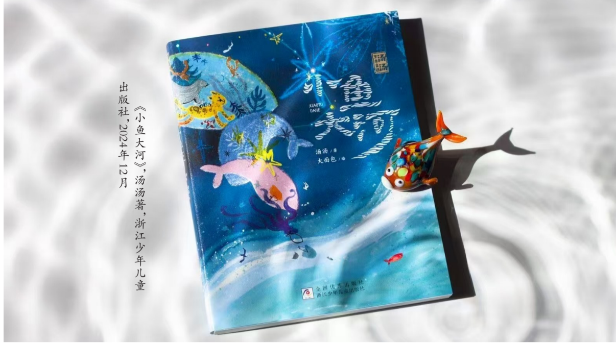
《小鱼大河》,汤汤著,浙江少年儿童出版社,2024年12月

汤汤将创作谈的题名定为“局限、绝境和奇迹”,写的是水洼中小鱼的局限和绝境。她说:“所有的生命都在局限里,时空的局限,身体的局限,认知的局限,我们这些渺小而又脆弱的生命如何去突破?”其实,她为自己设定的这一次写作探险又何尝不是局限中的破局之旅?因为,她全部的故事已被锁定在了“水洼”这一个小小的空间