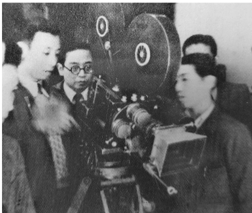
1936年，欧阳予倩带队拍摄《鲁迅先生逝世新闻》