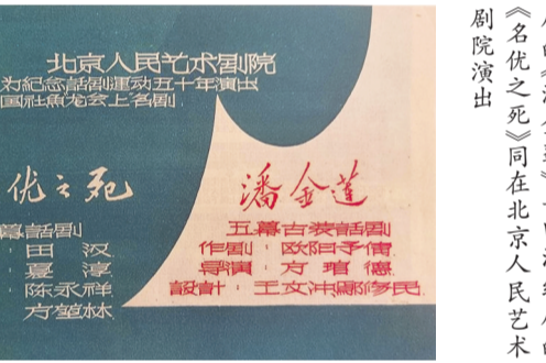
1957年，欧阳予倩编的《潘金莲》与田汉编剧的《名优之死》同在北京人民艺术剧院演出

论如何应该有。”据饰演陈白露的演员凤子回忆，欧阳予倩知道曹禺的想法后，感叹道：“对作者真是有说不出的歉意，怎样让作者明白我的用心呢？”欧阳予倩和曹禺都是剧作家，所以欧阳予倩对曹禺珍视作品之心是能够感同身受的。