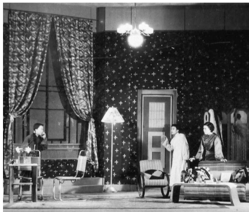
1937年，欧阳予倩执导曹禺编剧的《日出》剧照