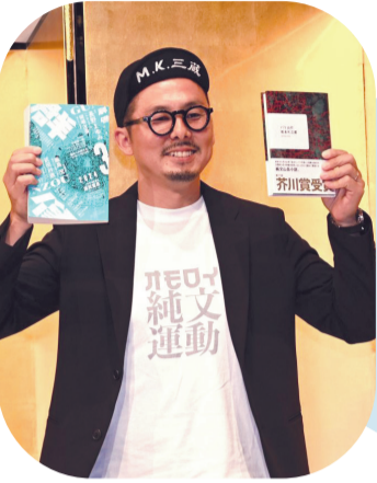
松永K三藏 《别道山行》