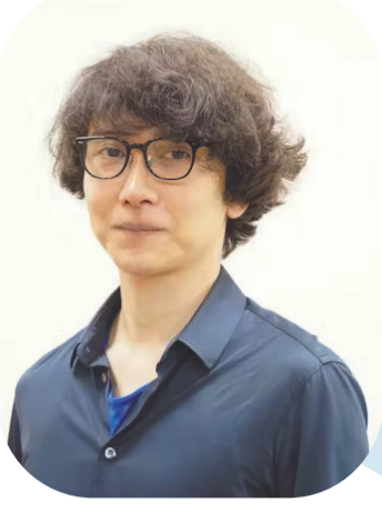
朝比奈秋 《山椒鱼的四十九天》