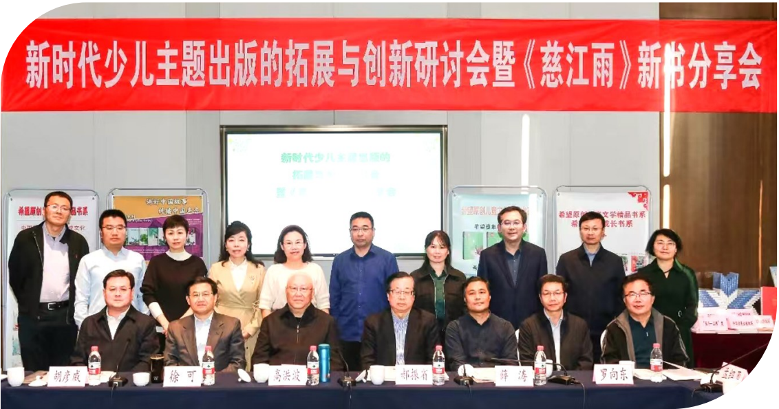
新时代少儿主题出版的拓展与创新研讨会暨《慈江雨》新书分享会现场