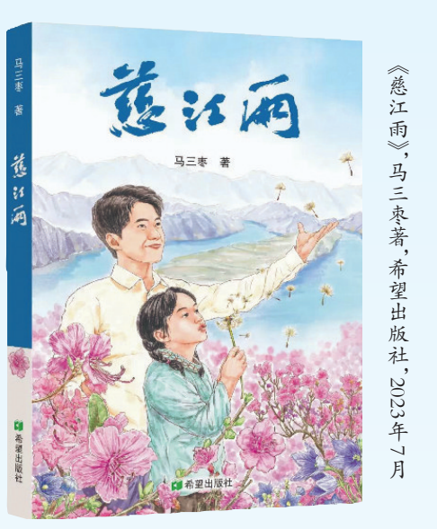
《慈江雨》,马三束著,希望出版社,2023年7月