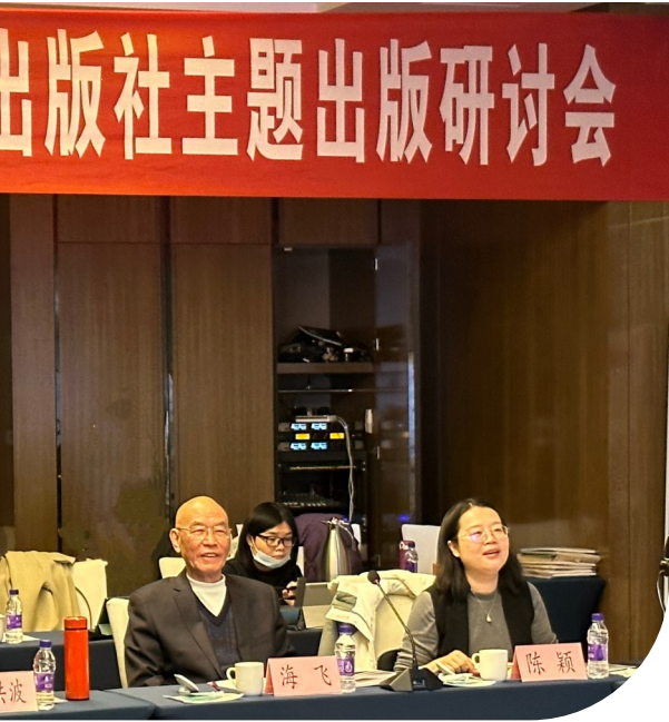
“学习二十大 奋进新征程”主题出版研讨会现场