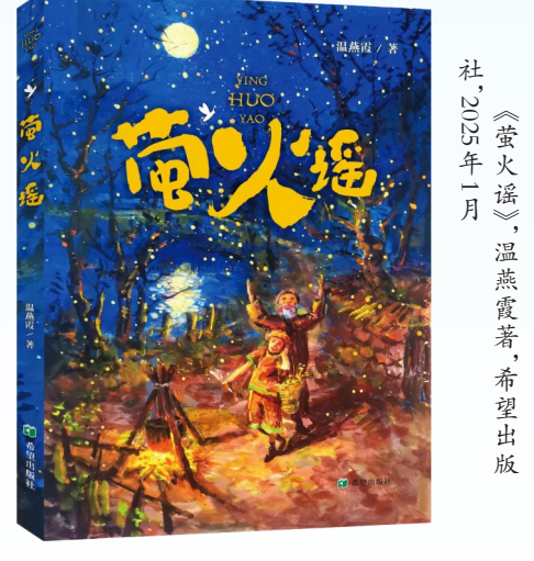
《萤火谣》,温燕霞著,希望出版社,2025年1月