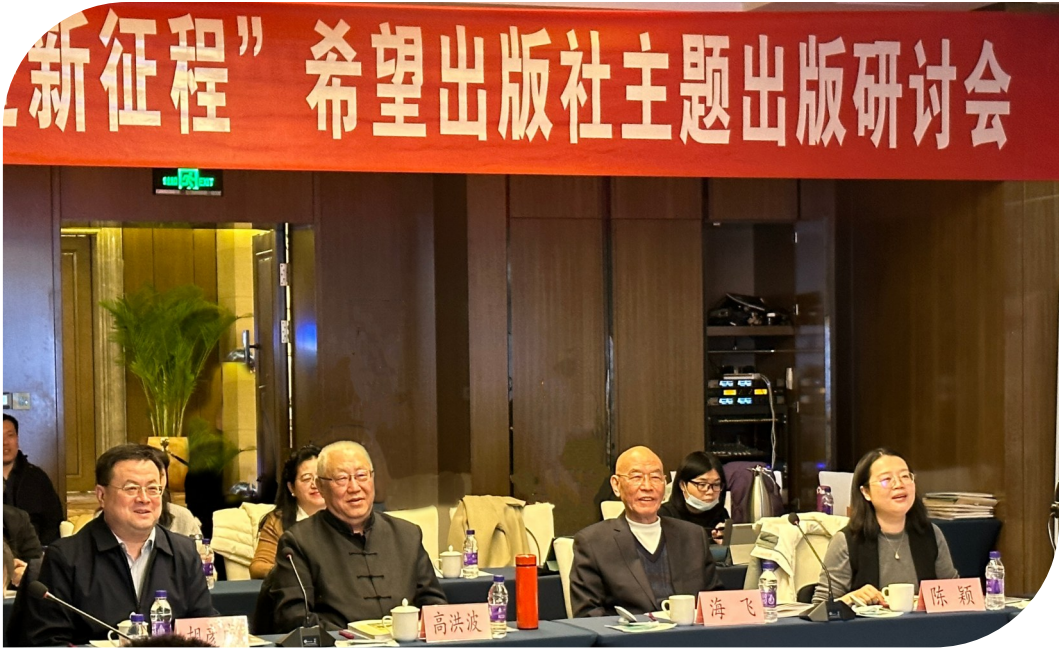
“学习二十大 奋进新征程”主题出版研讨会现场

儿童文学理论研究的前沿阵地,不仅巩固了其作为中国儿童文学研究出版重镇的地位,也成为展示出版社专业实力的重要窗口。