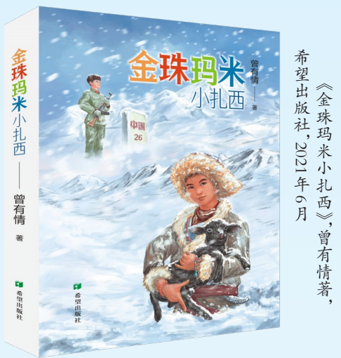
《金珠玛米小扎西》,曾有情著,希望出版社,2021年6月