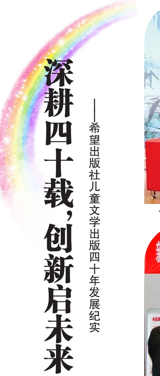
希望出版社儿童文学出版四十年发展纪实

近年来,希望社的“北斗星儿童文学理论文丛”持续推出多部重磅理论著作,包括《校准人生的坐标——给青少年的成长导航书》《童诗谭》《童谣谭》《童话谭》《童年的文化阐释》等。该文丛汇聚了高洪波、蒋风、王泉根、朱自强等国内儿童文学界的权威学者与知名作家,其出版的理论著作对新时代中国儿童文学的研究、创作与出版具有重要推动作用。文丛中的中长期项目多聚焦前沿课题,填补了理论研究的空白,兼具学术深度与出版价值。依托“北斗星”品牌,希望出版社不断拓展产品线,逐步构建起