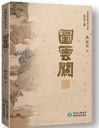
《图云关》，冉正万著，贵州民族出版社，2025年2月