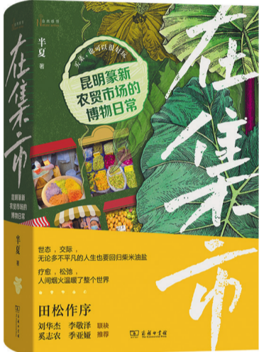
《在集市：昆明蒙新农贸市场的博物日常》，半夏著，商务印书馆，2025年5月