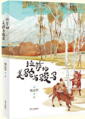
《拉萨的美驼与骏马》 杨志军 著 明天出版社 2025年6月出版

本书讲述了两位藏族少年为护送国家重点保护野生动物重返森林，分别骑着自己心爱的坐骑——骆驼和骏马，从拉萨出发，踏上漫长的回家旅程。作品追寻两路建设者的艰辛足迹，聆听筑路蓝缕的传奇故事，在风雪征途上教会读者担当、坚韧，以及与万物和谐共生的自然之道，引导孩子们从高海拔牧区人与动物相知相守的动人故事中，坚定接续祖辈奋斗征程、建设人与自然和谐共生美好家园的决心。