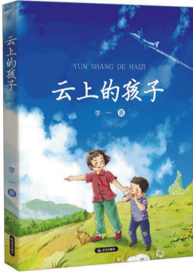
《云上的孩子》，李一著，晨光出版社，2025年1月

小说主人公沐小桃、沐小橘姐弟俩就是在这样的环境下成长起来的可爱孩子。小说主要通过沐小桃的视角，去观察在深山里为国家制造飞机的航空人，她看到的是普通劳动者在平凡岗位上的默默耕耘，是航空人辛勤奉献的爱国情怀。这是沐小桃长大后回顾自己童年时得出的结论，其实这些结论都是由一点点的日常小细节连缀起来的，当时孩子们从来没有想到这些细节会包含如此宏大的意义。比如小说写道：沐小橘有次和父亲一起去露天影院看电影，突然下起大雨了，父亲抱起沐小橘冒雨回家，却把沐小橘的一件新短袖遗失在影院的看台上。沐小橘哭着要自己的新短袖。父亲这时听到喇叭在通知抢险队赶紧参加抗洪抢险。父亲二话没说，把沐小橘放在家里就去参加抢险了。父亲抢险干了整整一夜，第二天早上拖着疲惫的身子回家，他在回家的路上意外地从积水里找到了儿子丢失的短袖。高兴的儿子问父亲是怎么找到的，父亲夸张地告诉儿子，