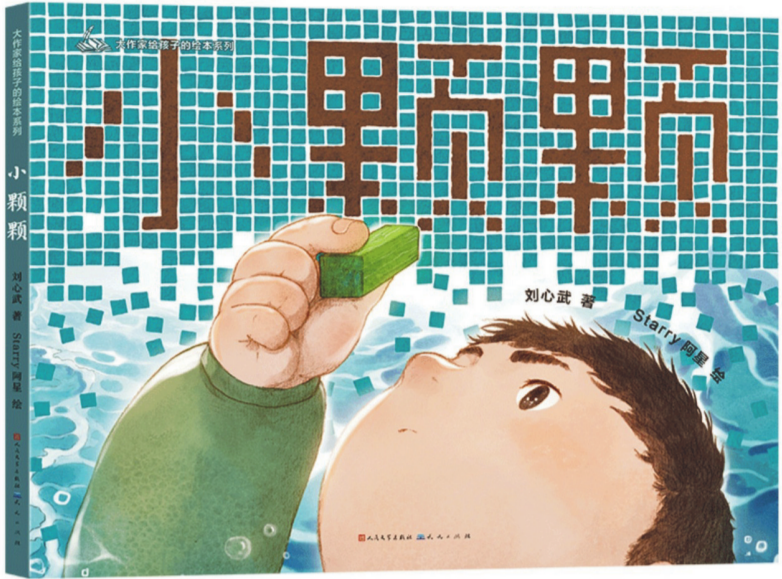
《小颗颗》，刘心武著，人民文学出版社、天天出版社，2024年10月

《小颗颗》将那段充满离愁别绪与对未知世界探索渴望的时光，用简洁而生动的文字呈现在读者面前。“小颗颗”不仅仅是一个玩具，它承载着作者童年的欢乐、纯真，更是他面对生活变化时内心世界的的一个象征。从成长的