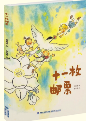
《十一枚邮票》 舒辉波 文 李卓锐 图 福建少年儿童出版社 2025年4月出版

本书讲述了两位藏族少年为护送国家重点保护野生动物重返森林，分别骑着自己心爱的坐骑——骆驼和骏马，从拉萨出发，踏上漫长的回家旅程。作品追寻两路建设者的艰辛足迹，聆听筑路蓝缕的传奇故事，在风雪征途上教会读者担当、坚韧，以及与万物和谐共生的自然之道，引导孩子们从高海拔牧区人与动物相知相守的动人故事中，坚定接续祖辈奋斗征程、建设人与自然和谐共生美好家园的决心。