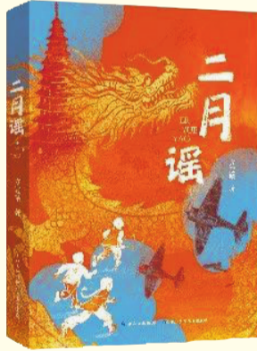
《二月谣》 方冠晴 著 长江少年儿童出版社 2025年4月出版

绘本以图文并茂的方式，在复古质感中融入现代艺术表现力，将鼓岭地貌特征、历史建筑元素、邮票元素等进行视觉转译，深入挖掘并呈现了中美友好历史中那段动人心弦的“鼓岭故事”。作品将历史与现实、情感与故事巧妙地融合在一起，以情感温度点燃孩子的阅读热情，将“和平、友谊、爱”传达给全世界，引领读者们深入地思考鼓岭故事中所蕴含的人类命运共生的意蕴。