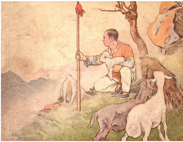
《鸡毛信》插图 刘继卣 绘

华山的《鸡毛信》堪称抗战儿童文学的经典范本。这部短篇小说以华北抗日根据地的烽火硝烟为底色,讲述了几童团长海娃临危受命去给八路军张连长送鸡毛信的故事。作品问世以来如不灭的星火,成为几代中国孩子共同的红色记忆。