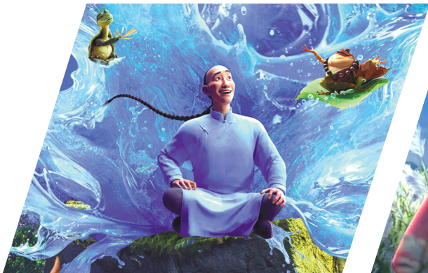
自左向右:玄龟子、蒲松龄、灵蟾上人