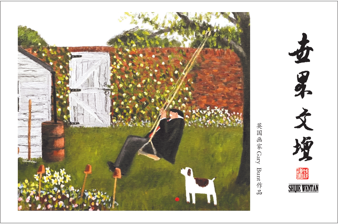
英国画家 Gary Burn 作品