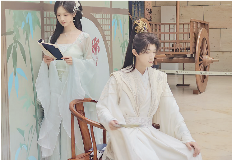
国庆期间,番茄小说联合南京文旅打造“跟着冒姓琅琊打卡南京”线下活动。图为演员在南京六朝博物馆Cosplay(角色扮演)小说里的男女主角

这部书的核心主题,我定义为“活在南北朝”。这里的“活”有两层意思:一是“生活”,我不想让故事只是追着剧情跑,而是让读者跟着主角,实实在在体验那个时代的饮食、文学、宗教与艺术,当然也少不了乱世中的刀光剑影和血雨腥风;二是“存活”,我想探讨一个普通人——没有秘籍神功、“主角光环”、气运加身——穿越到波诡云谲的南北朝,该如何活下去?他的选择会引发怎样的连锁反应?就像一场“历史观测实验”,看着这个人在时代洪流中挣扎、成长,也透过他的眼睛,看见那个时代的文明与野蛮、壮丽与黑暗,以及人性中的伟大与卑微、屈服与抗争。